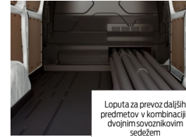
Loputa za prevoz daljših predmetov v kombinaciji z dvojnimi sovoznikovim sedežem (ni na voljo s pogonom mHEV)