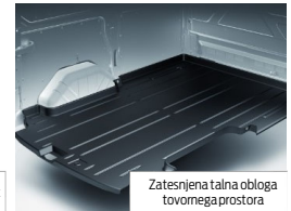
Zatesnjena talna obloga tovornega prostora