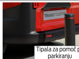
Tipala za pomoč pri parkiranju