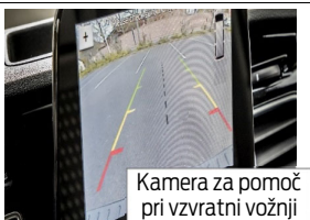
Kamera za pomoč pri vzvratni vožnji