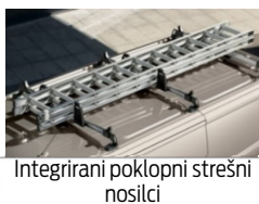
Integrirani poklopni strešni nosilci