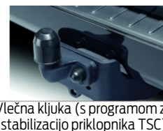
Vlečna kljuka (s programom za stabilizacijo priklopnika TSC)