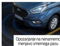
Opozarjanje na nenamerno menjavo smernega pasu