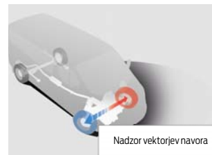
Nadzor vektorjev navora