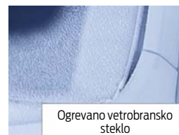
Ogrevano vetrobransko steklo