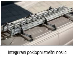
Integrirani poklopni strešni nosilci