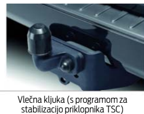
Vlečna kljuka (s programom za stabilizacijo priklopnika TSC)