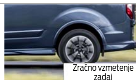
Zračno vzmetenje zadaj