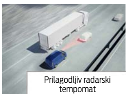
Prilagodljiv radarski tempomat