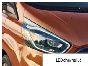
LED dnevne luči