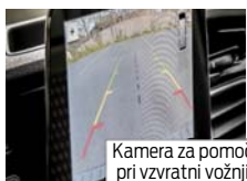
Kamera za pomoč pri vzvratni vožnji