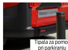
Tipala za pomoč pri parkiranju