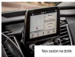
Nov zaslon na dotik