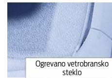
Ogrevano vetrobransko steklo