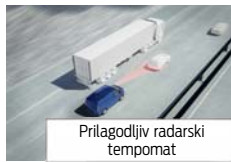
Prilagodljiv radarski tempomat

KODA AMBIENTE MPC (€) TREND MPC (€) SPORT MPC (€)