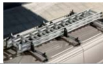
Integrirani poklopni strešni nosilci