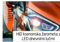
HID ksenonska žarometi z LED dnevnimi lučmi