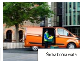
Široka bočna vrata