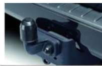
Vlečna kljuka (s programom za stabilizacijo priklopnika TSC)