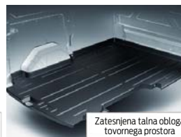
Zatesnjena talna obloga tovernega prostora