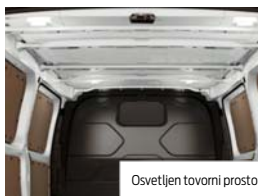
Osvetljen tovorni prostor