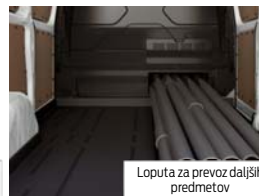
Loputa za prevoz daljših predmetov