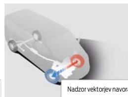
Nadzor vektorjev navora