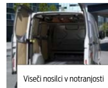
Viseči nosilci v notranjosti