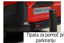
Tipala za pomoč pri parkiranju