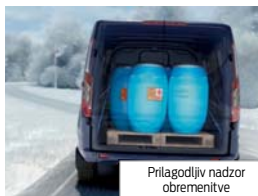
Prilagodljiv nadzor obremenitve