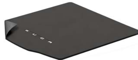
Obojestranski tepih za prtljažni prostor