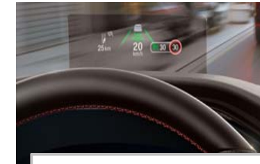
Projekcijski zaslon Head up