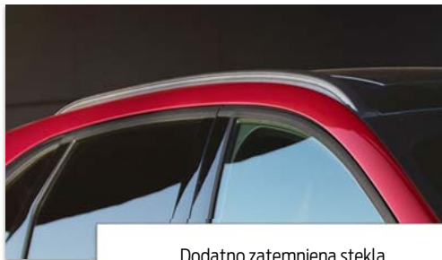
Dodatno zatemnjena stekla