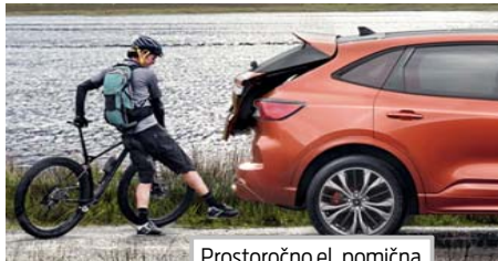
Prostoročno el. pomična prtljažna vrata