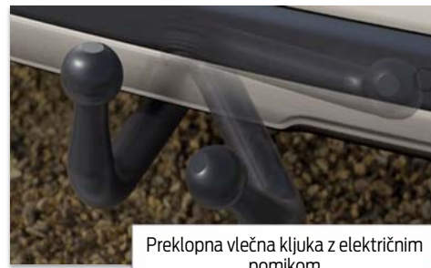
Preklopna vlečna kljuka z električnim pomikom