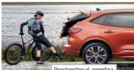
Prostoročno el. pomična prtljažna vrata