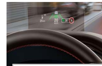
Projekcijski zaslon Head up