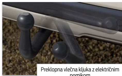
Preklopna vlečna kljuka z električnim pomikom