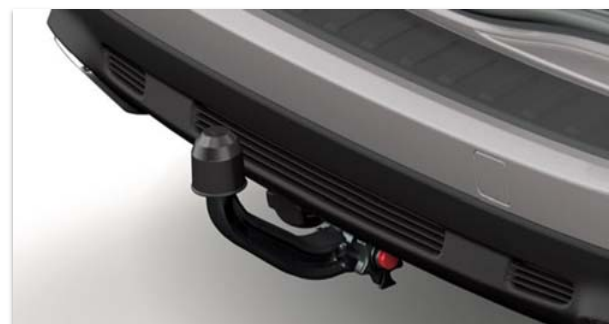
Snemljiva vlečna kljua