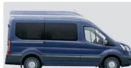
Visoka višina strehe (H3)