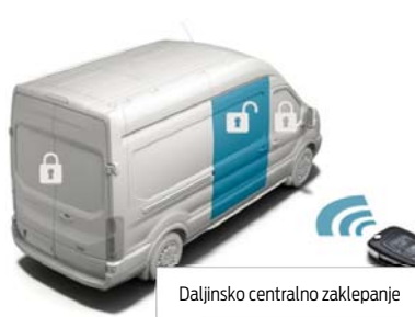
Daljinsko centralno zaklepanje