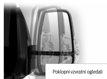
Poklopni vzvratni ogledali