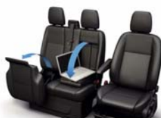
Dvojni sovoznikov sedež z dvizno blazino