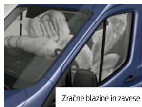
Zračne blazine in zavesa