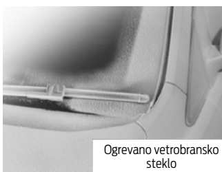
Ogrevano vetrobransko steklo