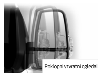
Poklopni vzvratni ogledali