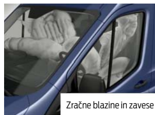
Zračne blazine in zavesa