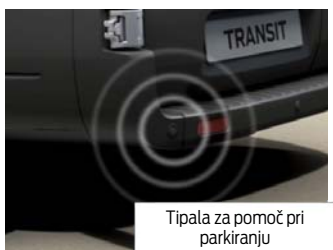
Tipala za pomoč pri parkiranju