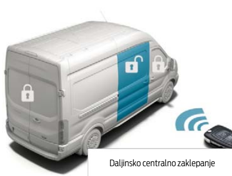
Daljinsko centralno zaklepanje