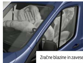
Zračne blazine in zavesa