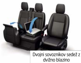
Dvojni sovoznikov sedež z dvižno blazino