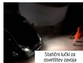
Statični lučki za osvetlitev zavoja