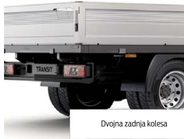
Dvojna zadnja kolesa