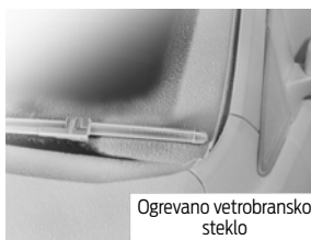
Ogrevano vetrobransko steklo