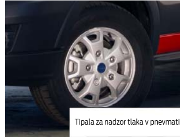
Tipala za nadzor tlaka v pnevmatikah