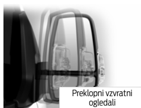
Preklopni vzratni ogledali