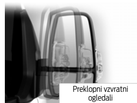
Preklonni vzratni ogledali