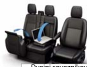
Dvojni sovoznikov sedež z dvizno blazino