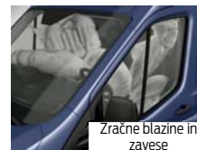
Zračne blazine in zavesa