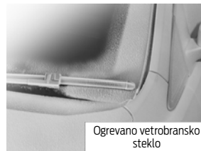
Ogrevano vetrobransko steklo