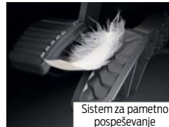
Sistem za pametno pospeševanje