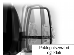
Poklopni vzvratni ogledali