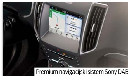
Premium navigacijski sistem Sony DAB