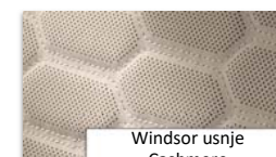
Windsor usnje Cashmere