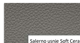
Salerno usnje Soft Ceramic