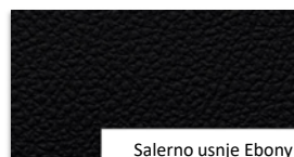
Salerno usnje Ebony