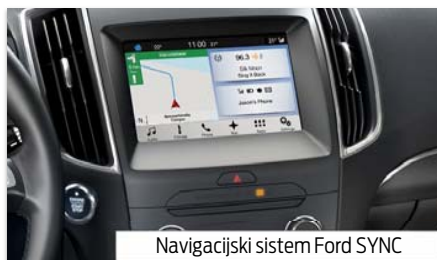
Navigacijski sistem Ford SYNC