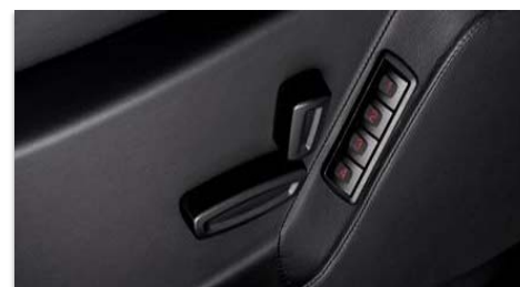
Električno nastavljava sedeži s spominsko funkcijo