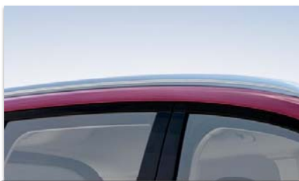
Vzdolžna strešna nosilca