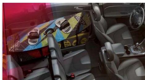
Sedeža v tretji vrsti