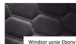
Windsor usnje Ebony