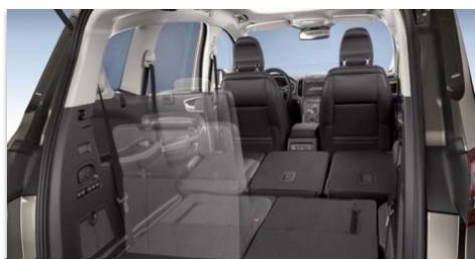
Elektro-mehanskega podiranje sedežev 'Easy Fold Flat'