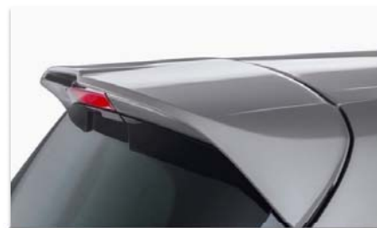
Velik zadnji strešni spojler