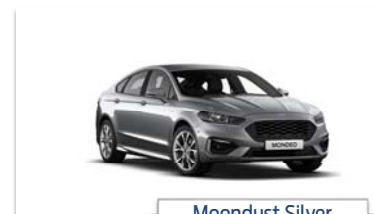
Moon dust Silver