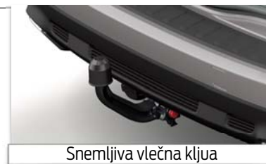
Snemljiva vlečna kljua