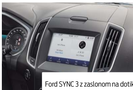
Ford SYNC 3 z zaslonom na dotik