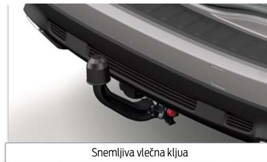
Snemljiva vlečna kljua