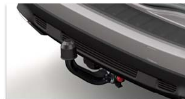
Snemljiva vlečna kljua