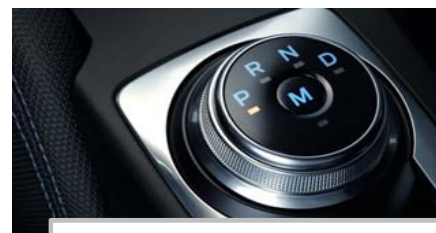
Samodejni 8-stopenjski menjalnik