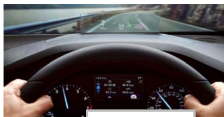
Heads up display

SVO barva karoserije (minimalno naročilo 3 vozila)