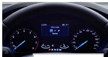
Izbira voznega načina