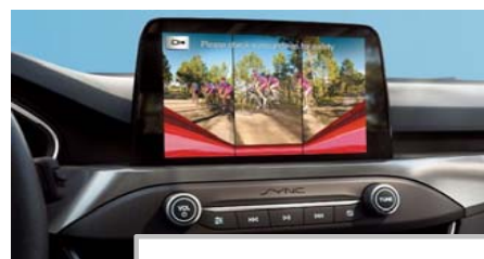
Kamera za pomoč pri vzvratni vožnji