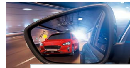
Sistem za zaznavanje mrtvega kota