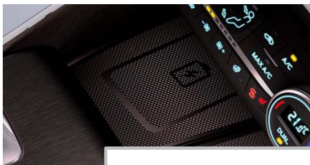
Brezžično polnjenje telefona