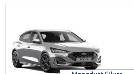
Moon dust Silver