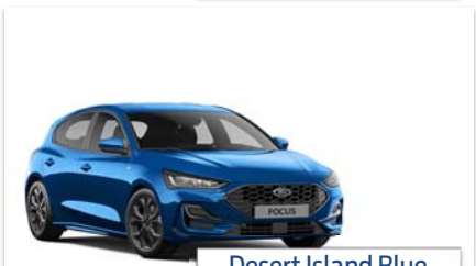
Desert Island Blue