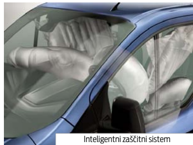
Inteligentni zaščitni sistem