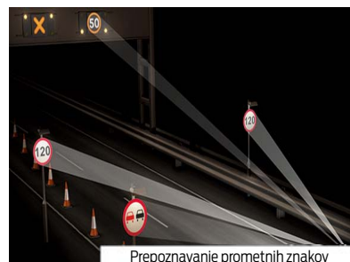
Prepoznavanje prometnih znakov