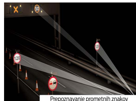
Prepoznavanje prometnih znakov