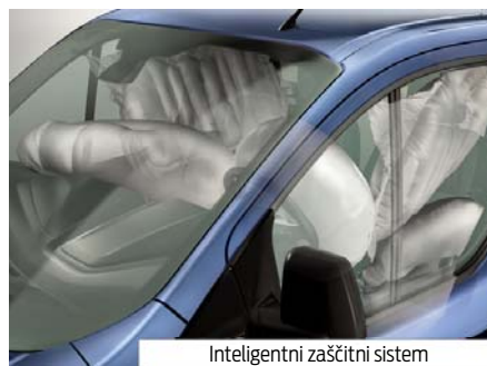
Inteligentni zaščitni sistem