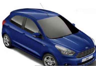
Deep Impact Blue