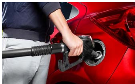
Sistem za preprečevanje dolivanja napačnega goriva Ford EasyFuel