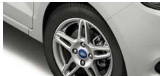
15" platišča iz lahke zlitine