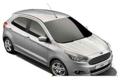
Moon dust Silver