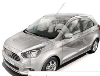
Zračne blazine in zavese