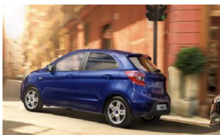
Pomoč pri speljevanju v klanec HLA

Digitalni radio (komercialno znan kot DAB) je tehnologija, ki bi omogočila znatno razširitev prostora za frekvence radijskih postaj, saj slednje spekter frekvenc FM tehnologije že zelo omejuje. Prednosti digitalnega radia so predvsem odpornost na motnje pri sprejemu, več radijskih programov znotraj enako širokega frekvenčnega pasu, tehnološko prilagojen mobilnemu sprejemu ter možnost dodatnih storitev.