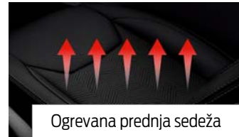
Ogrevana prednja sedeža