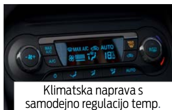
Klimatska naprava s samodejno regulacijo temp.