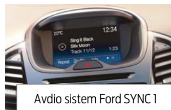
Avdio sistem Ford SYNC 1