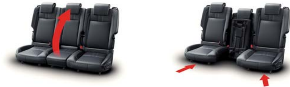
Zadaj sedeži, drsni in poklopni