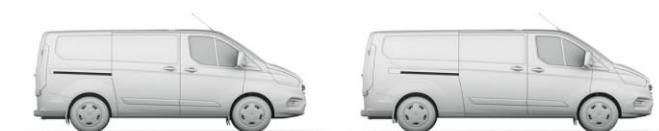
L1 H1 6,0 m 3

L1 = krátky rázor, L2 = dlhý rázor. H1 = nízka strecha, H2 = vysoká strecha. Všetky rozmery (vedené v mm) podliehajú výrobným toleranciam, zahŕňajú minimálnu výbavu a neobsahujú žiadnu výbavu na pranie. *Výškové rozmery uvádzajú interval od minima po maximum nenačleneného a plne naloženého vozidla. Uvedené nákresy sú iba orientačné. Metóda VDA - objem určený tak, že sa nákladový priestor zaplní kvádrmi s objemom 1 liter a s rozmermi 200x100x50 mm. Kvádre sa potom spočítajú a výsledok sa prepočíta na m 3 . Metóda SAE - túto metódu používa organizácia Society of Automotive Engineers. Hodnota SAE sa určí spríemerovaním dvoch rozmerov výšky, dĺžky a šírky, ktoré sa vynásobia, aby sa odvodil objem v metroch kubických. Maximálny objem nákladového priestoru - spočíva v odmeraní objemu nákladového priestoru pomocou zrnitého materiálu ako je piesok alebo ryža, ktorým na nákladový priestor naplní.