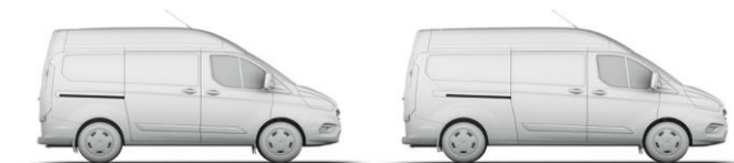
L1 H2 7,2 m 3