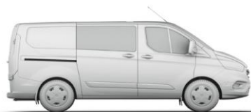
L1 H1 3,5 m 3

L1 = krátky rázvor, L2 = dlhý rázvor, H1 = nízka strecha, H2 = vysoká strecha. Všetky rozmery (uvedené v mm) podliehajú výrobným toleranciam, zahŕňajú minimálnu výbavu a neobsahujú žiadnu výbavu na prílie. *Výškové rozmery uvádzajú interval od miníma po maximum nenaloženého a plne naloženého vozidla. Uvedené nákresy sú iba orientačné. Metóda VDA - objem určený tak, že sa nákladový priestor zaplní kvádrmi s objemom 1 liter a s rozmermi 200x100x50 mm. Kvádre sa potom spočítajú a výsledok sa prepočíta na m 3 . Metóda SAE - túto metódu používa organizácia Society of Automotive Engineers. Hodnota SAE sa určí spriemerovaním dvoch rozmerov výšky, dĺžky a šírky, ktoré sa vynásobia, aby sa odvodil objem v metroch kubických. Maximálny objem nákladového priestoru - spočíva v odmeraní objemu nákladového priestoru pomocou zrnitého materiálu ako je piesok alebo ryža, ktorým na nákladový priestor naplní.