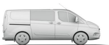
L1 H1 3,5 m 3

L1 = krátky rázvor, L2 = dlhý rázvor. H1 = nízka strecha, H2 = vysoká strecha. Všetky rozmery (uvedené v mm) podliehajú výrobným toleranciam, zahŕňajú minimálnu výbavu a neobsahujú žiadnu výbavu na pranie. *Výškové rozmery uvádzajú interval od minima po maximum nenaloženého a plne naloženého vozidla. Uvedené nákresy sú iba orientačné. Metóda VDA - objem určený tak, že sa nákladový priestor zaplní kvádrmi s objemom 1 liter a s rozmermi 200x100x50 mm. Kvádre sa potom spočítajú a výsledok sa prepočíta na m 3 . Metóda SAE - túto metódu používa organizácia Society of Automotive Engineers. Hodnota SAE sa určí spríemerovaním dvoch rozmerov výšky, dĺžky a šírky, ktoré sa vynásobia, aby sa odvodil objem v metroch kubických. Maximálny objem nákladového priestoru - spočíva v odmeraní objemu nákladového priestoru pomocou zrnitého materiálu ako je piesok alebo ryža, ktorým nákladový priestor naplní.