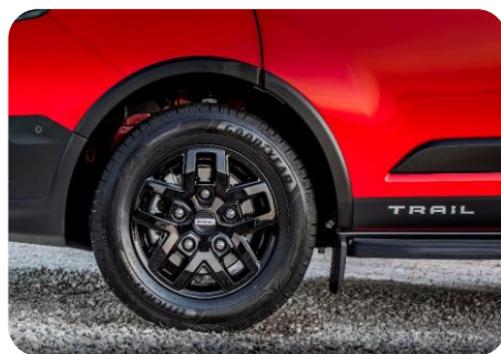
Verzia Trail (ilustračné foto)