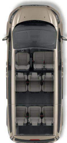
Tourneo Custom 9 θέσεων L1.