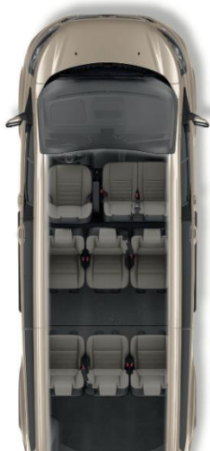
Tourneo Custom 9 θέσεων L2.